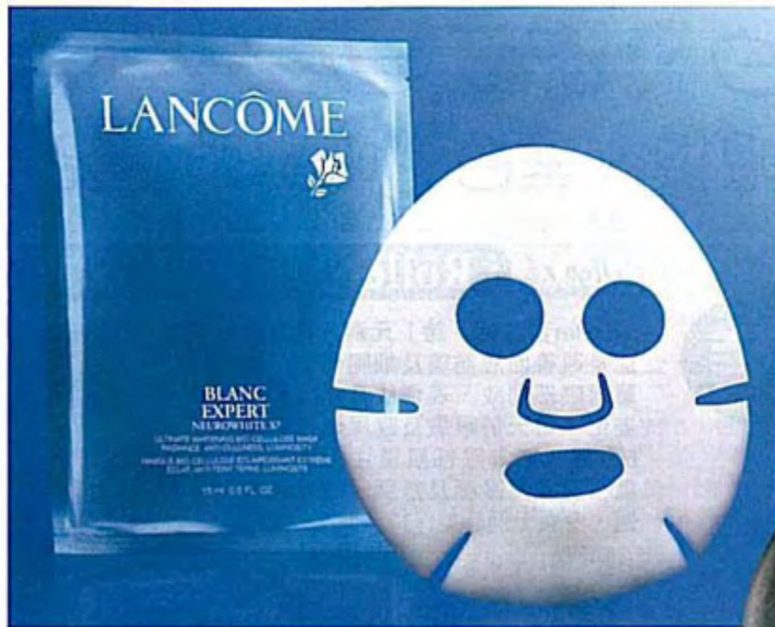
Lancôme Ultimate Whitening Biocellulose Gel Mask $600/6pcs