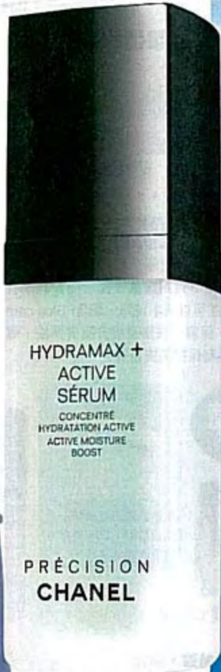
Chanel Precision Hydramax+ Active Serum Active Moisture Boost $530/30ml