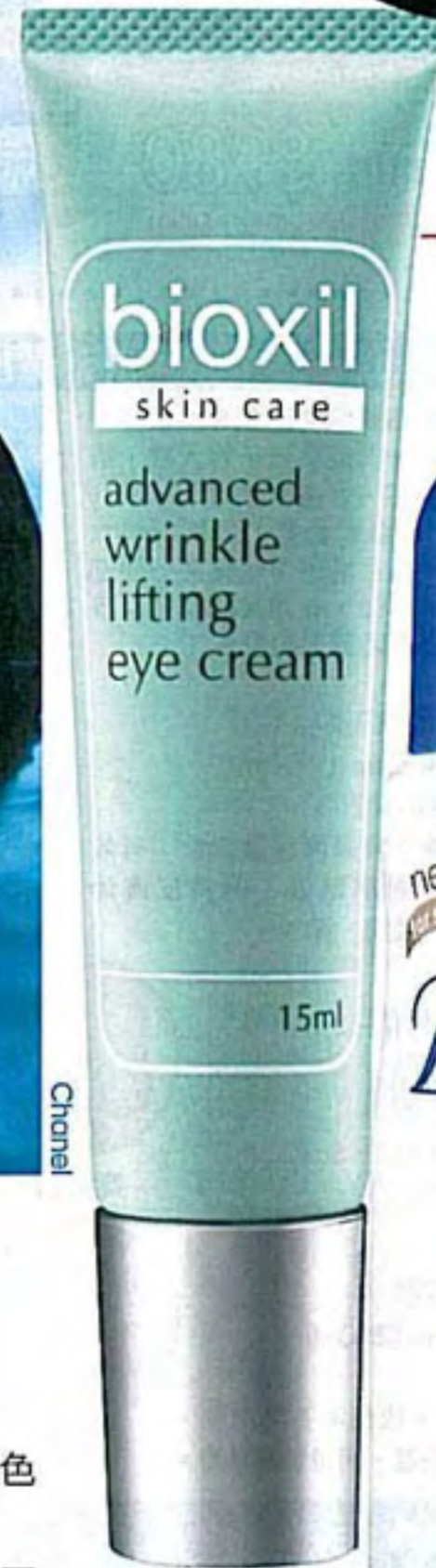
Bioxil Advanced Wrinkle Lifting Eye Cream $1,148/15ml