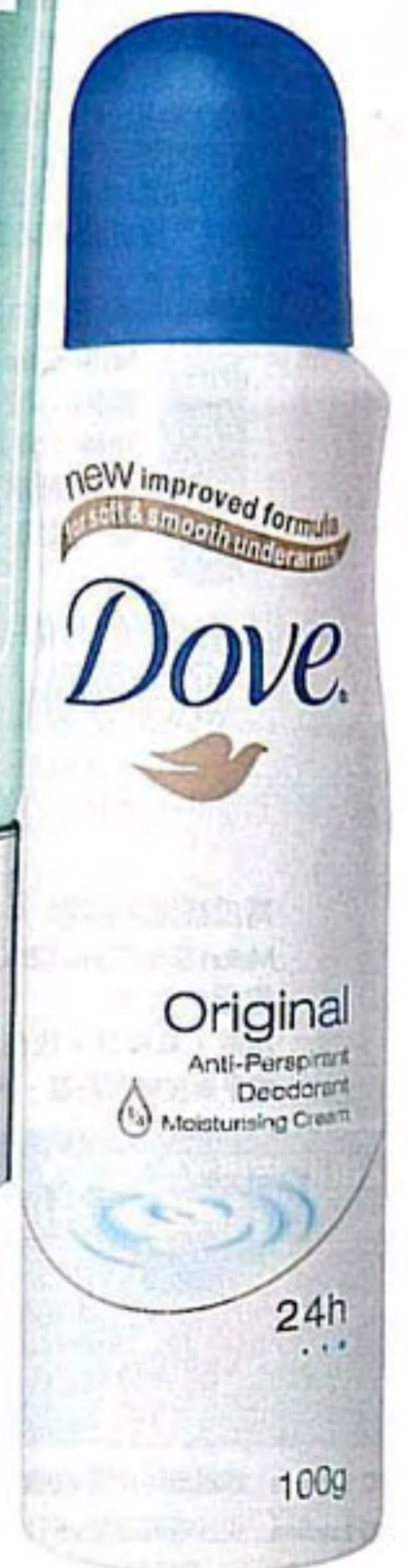
Dove Original Anti-Perspirant Deodorant Moisturising Cream $29.9/100g