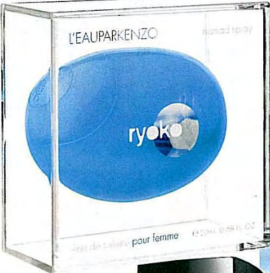
Kenzo L'EAUPARKENZO Ryoko EDT $260/20ml