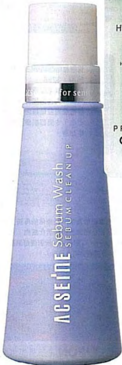
Acseine Sebum Wash $230/100g