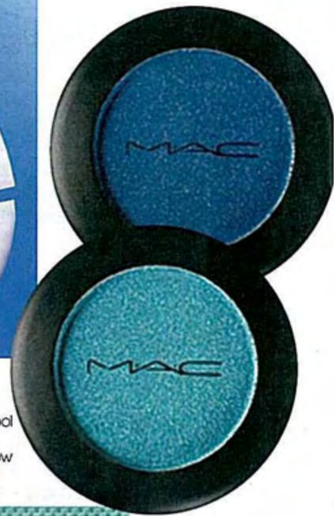
M.A.C Cool Heat Eyeshadow $120@