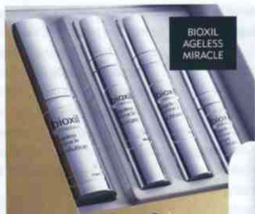
BIOXIL AGELESS MIRACLE