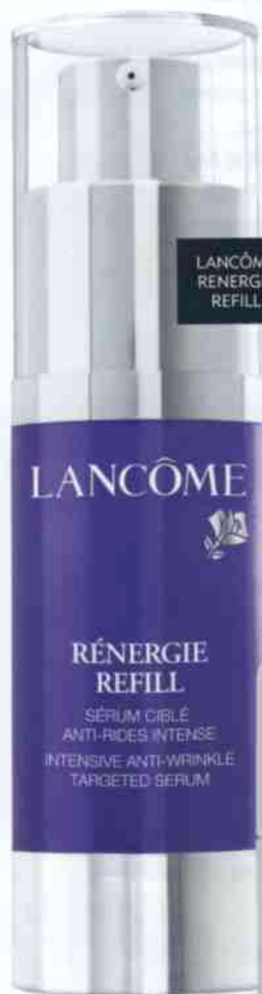
LANCÔME RENERGIE REFILL