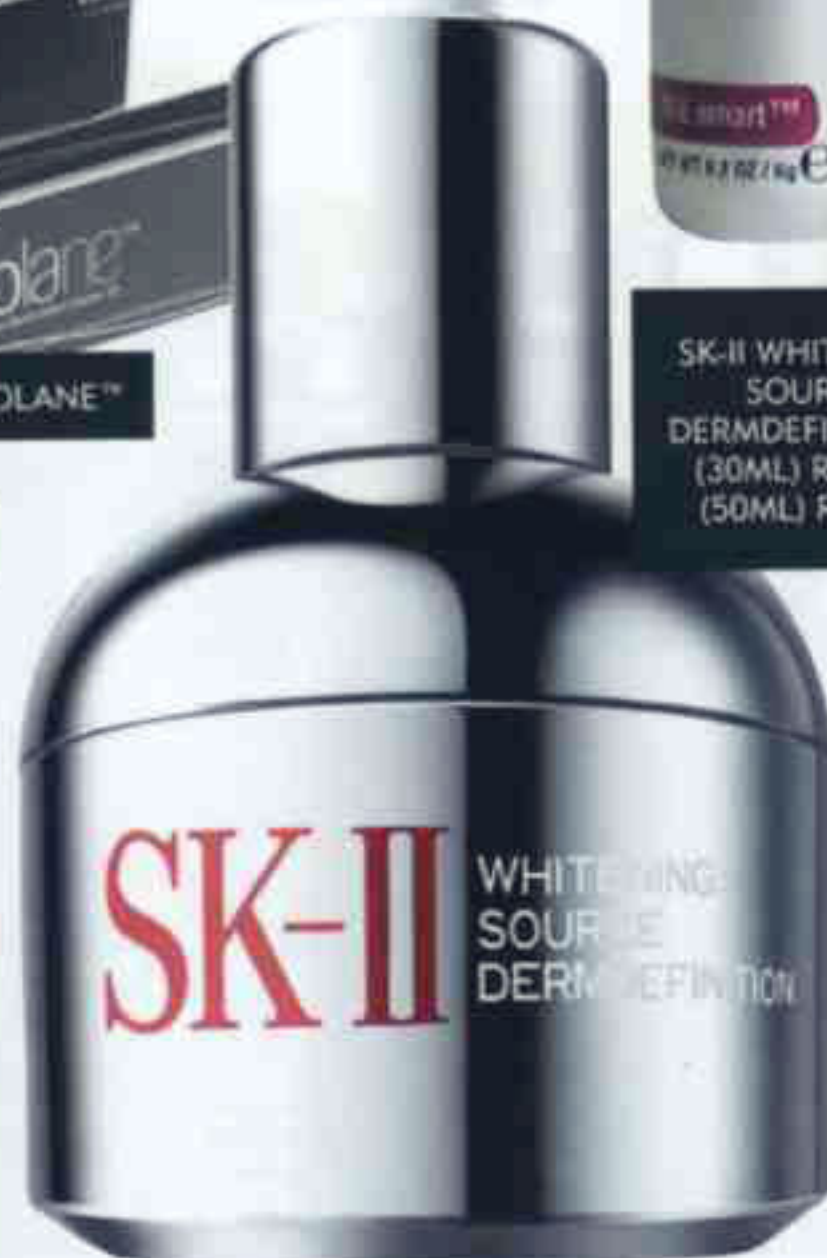
SK-II WHITENING SOURCE DERMDEFINITION